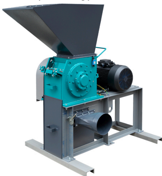
Рис. 1 Роторная ножевая мельница РМ 250.