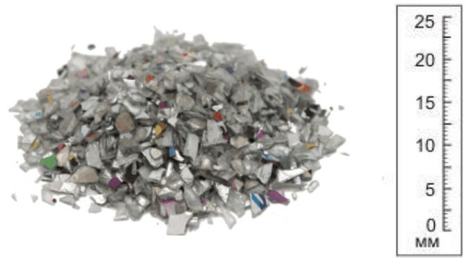
Рис. 4. Готовый продукт.