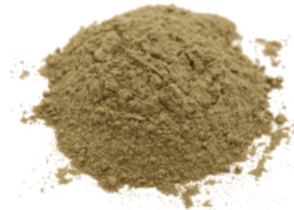
Рис. 4. Готовый продукт.