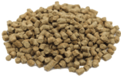
Рис. 3. Материал до измельчения.