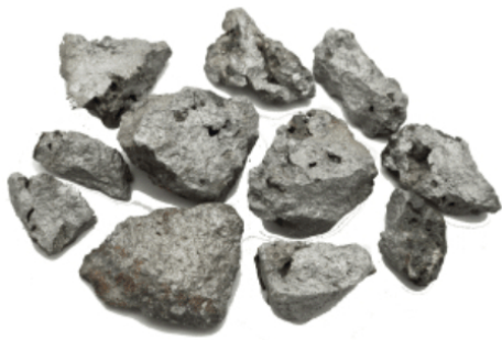
Рис. 3. Материал до измельчения.