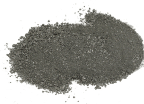
Рис. 4. Готовый продукт.