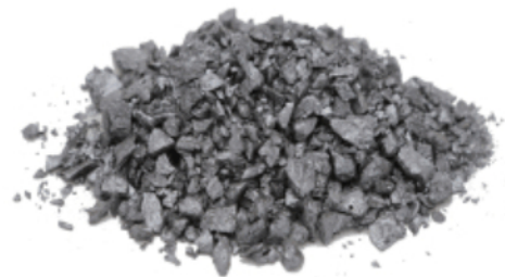
Рис. 3. Материал до измельчения.