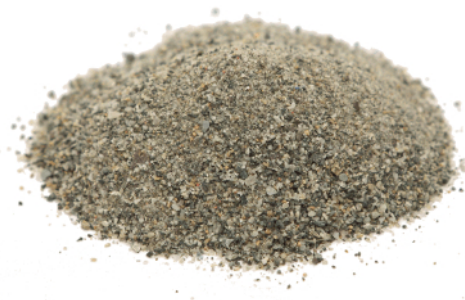
Рис. 3. Материал до измельчения.