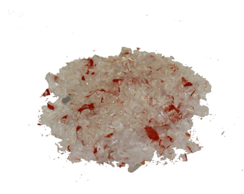
Рис.4. Готовый продукт