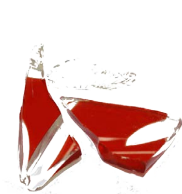
Рис.3. Материал до дробления