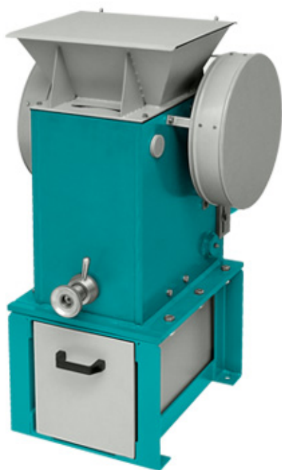
Рис 1. Щековая дробилка ЩД 10 на опоре