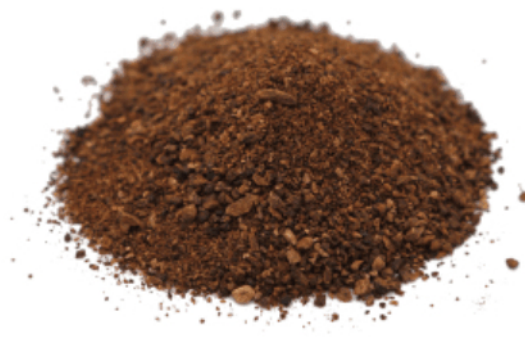
Рис. 4. Готовый продукт.