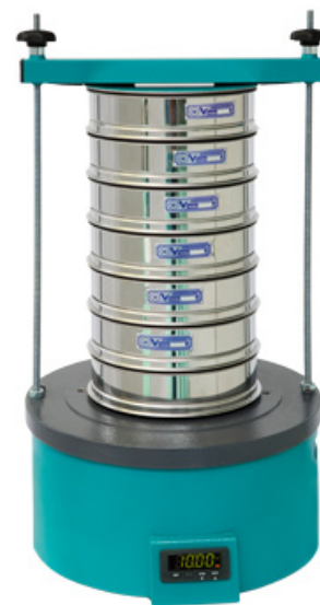
Рис. 3 Анализатор А 20.