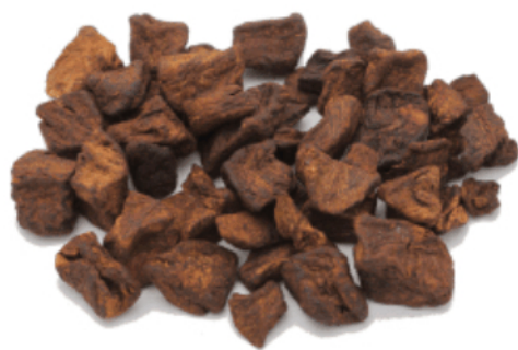
Рис. 3. Материал до измельчения.