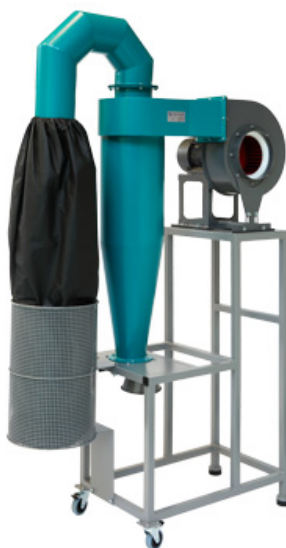
Рис. 2 БПУ.