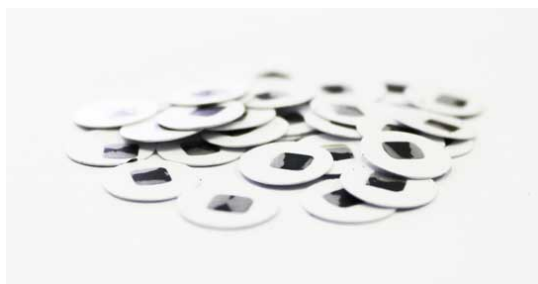
Рис.3. Материал до измельчения