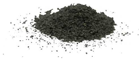
Рис.4. Продукт измельчения