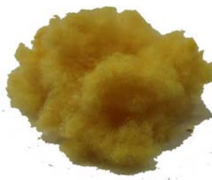
Рис.3. Продукт измельчения