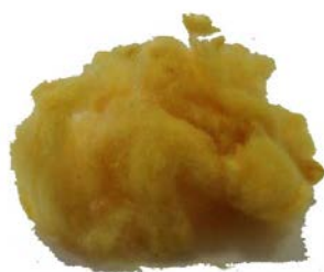
Рис.2. Материал до измельчения