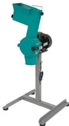
Рис 1. Роторная ножевая мельница РМ 120