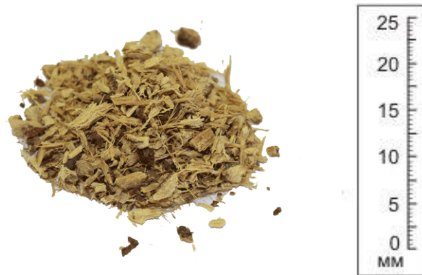
Рис.4. Готовый продукт