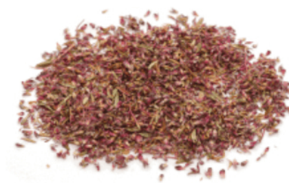
Рис. 4. Готовый продукт.