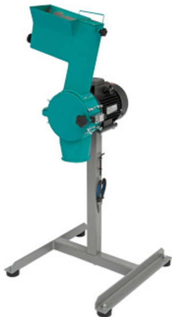
Рис. 1 Роторная ножевая мельница РМ 120.