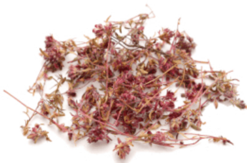
Рис. 3. Материал до измельчения.