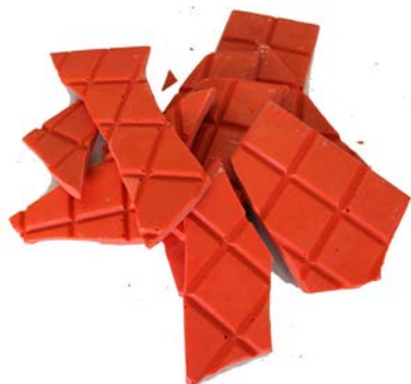
Рис.3. Материал до измельчения