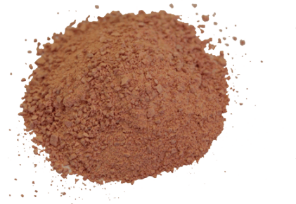
Рис.4. Готовый продукт