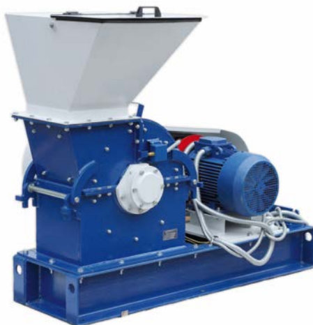
Рис. 1 Молотковая дробилка МД 5х2