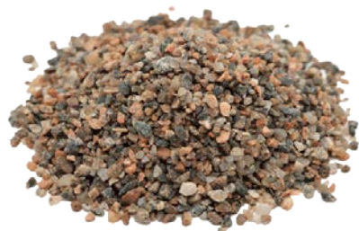
Рис.4. Готовый продукт