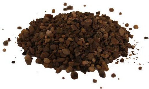
Рис.3. Материал до дробления