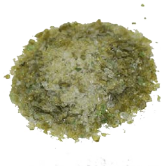
Рис.4. Готовый продукт