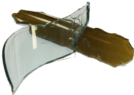
Рис.3. Материал до дробления