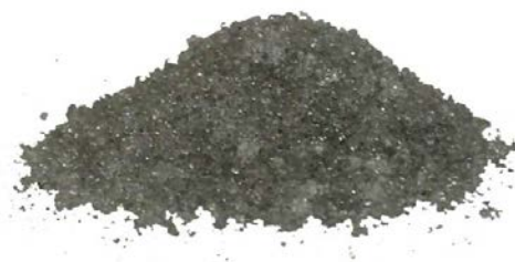
Рис.4. Готовый продукт