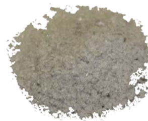
Рис.4. Готовый продукт