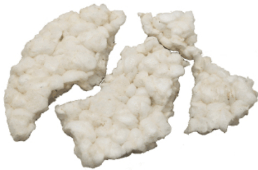
Рис. 3. Материал до измельчения.