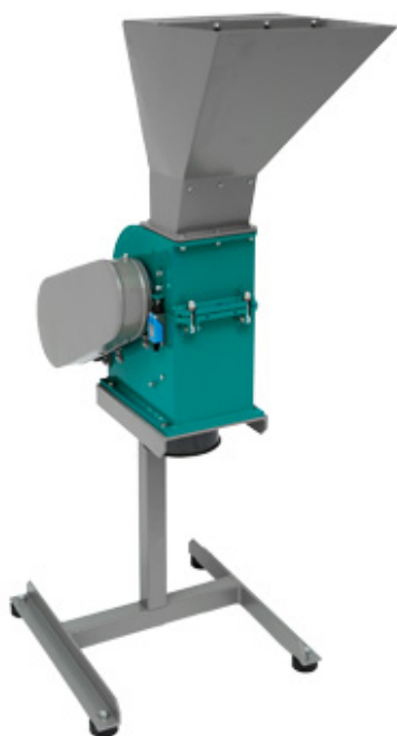
Рис 1. Молотковая дробилка МД 2х2.