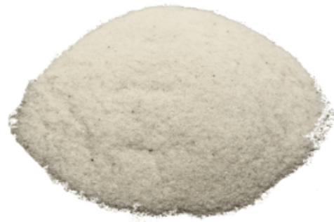
Рис. 4. Готовый продукт.