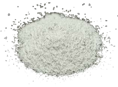
Рис.4. Готовый продукт