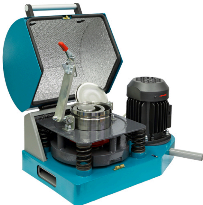
Рис 1. Истиратель вибрационный ИВ 1