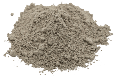
Рис.3. Материал до дробления