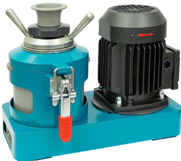
Рис 1. Истиратель дисковый ИД 65