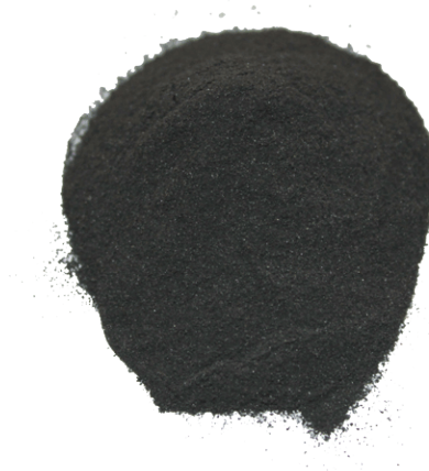
Рис.3. Материал до измельчения