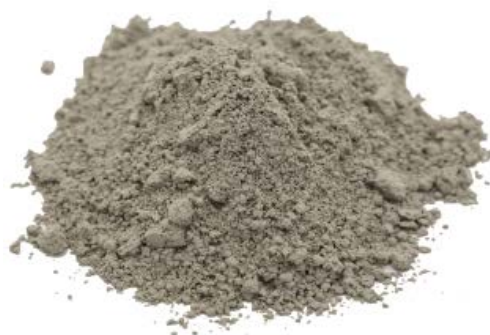
Рис.4. Готовый продукт