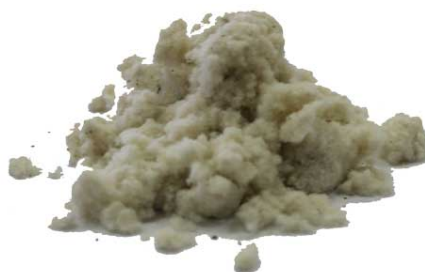
Рис.3. Продукт измельчения