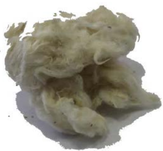
Рис.2. Материал до измельчения