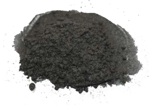
Рис.4. Готовый продукт