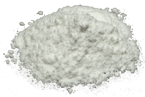
Рис.4. Готовый продукт