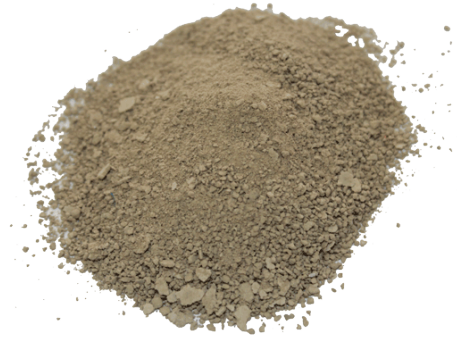
Рис.4. Готовый продукт