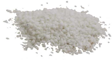
Рис.4. Готовый продукт