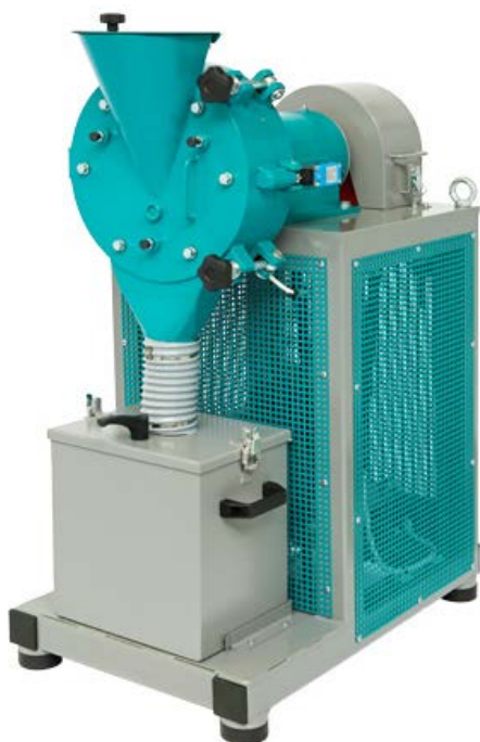
Рис 1. Истиратель дисковый ИД 200