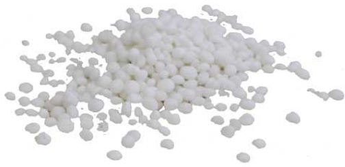
Рис.3. Материал до измельчения