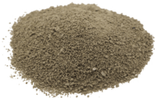
Рис. 3. Материал до измельчения.