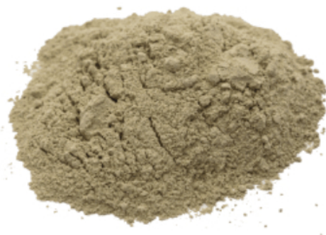
Рис. 4. Готовый продукт.