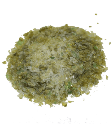
Рис.3. Материал до дробления