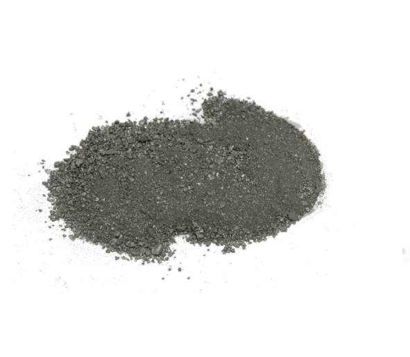
Рис.3. Материал до истирания