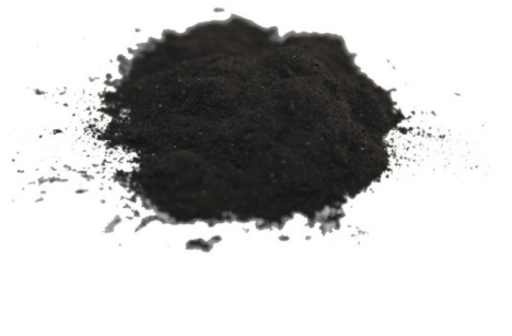
Рис.4. Готовый продукт