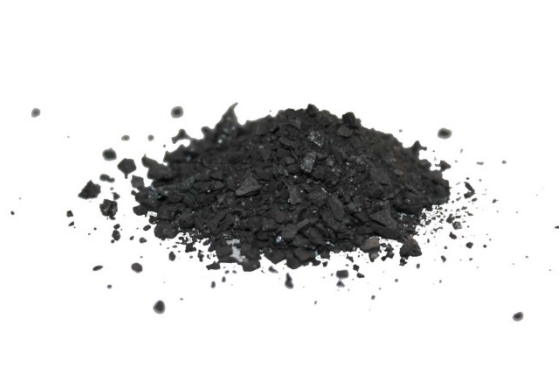
Рис.3. Материал до дробления