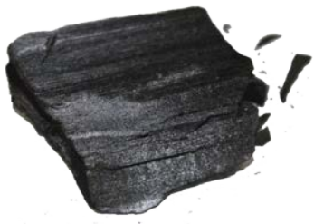
Рис.3. Материал до измельчения