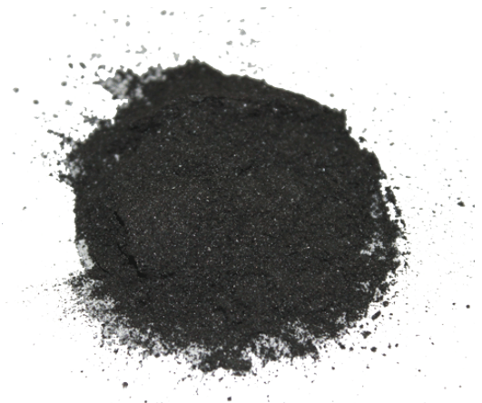
Рис.4. Готовый продукт