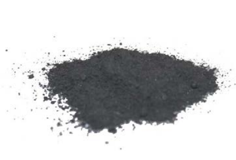
Рис.4. Продукт измельчения