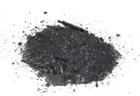
Рис.3. Материал до измельчения