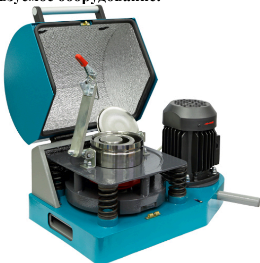
Рис 1. Истиратель вибрационный ИВ 1