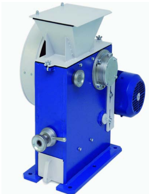
Рис. 1 Щековая дробилка ЩД 6.