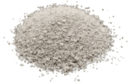
Рис. 4. Готовый продукт.