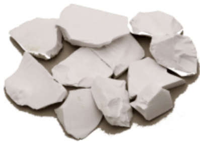
Рис. 3. Материал до дробления.