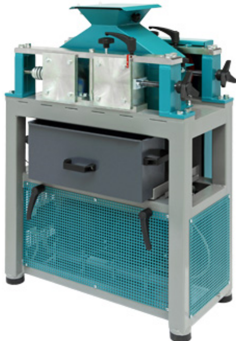
Рис. 1 Дробилка валковая ДГ 200x125.